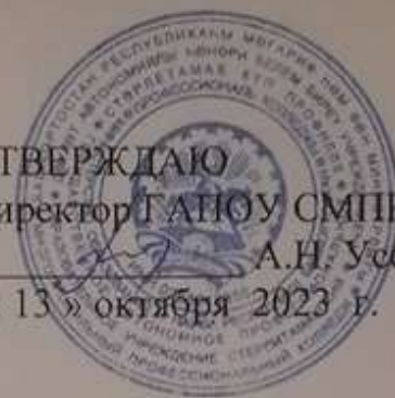
ГРАФИК ПРОМЕЖУТОЧНОЙ АТТЕСТАЦИИ

группы ПСА-18 специальность 40.02.03 Право и судебное администрирование